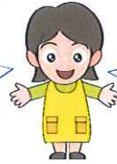
セミナー 参加者の感想